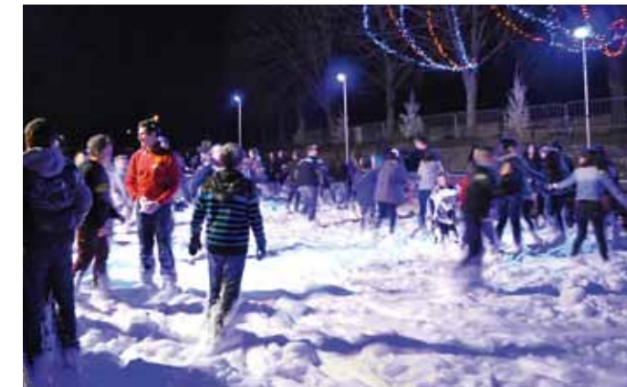
> La soirée mousse a été très prisée !