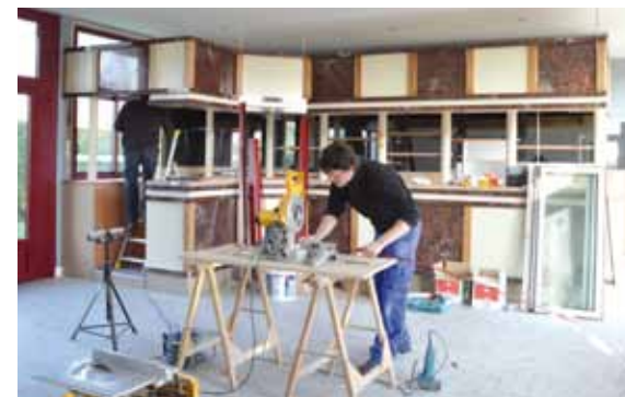
> Remplacement des menuiseries du bar-brasserie.

Les travaux de rénovation du bar-brasserie de l'Île d'Or se sont terminés comme prévu le 17 mars dernier. Le chantier a duré 8 semaines. Les menuiseries ont été changées dans la salle de restauration et la réserve, elles sont dorénavant étanches à l'air et donc moins énergivores. Le plafond de ces deux pièces a été isolé et les lames aluminium ont été remplacées par des plaques de plâtre. La mise aux normes électriques du bâtiment a été réalisée ainsi qu'un rafraîchissement des peintures intérieures. À l'extérieur, les gouttières ont été changées, la terrasse rénovée et agrandie par les services techniques de la Ville. Grâce à la rampe d'accès créée, les personnes à mobilité réduite peuvent accéder à la terrasse et au bar. Le coût total des travaux s'élève à 63 000 € financés par la Ville d'Amboise. Le bâtiment appartient à la Ville qui a mis en place, après un appel à projet lancé en