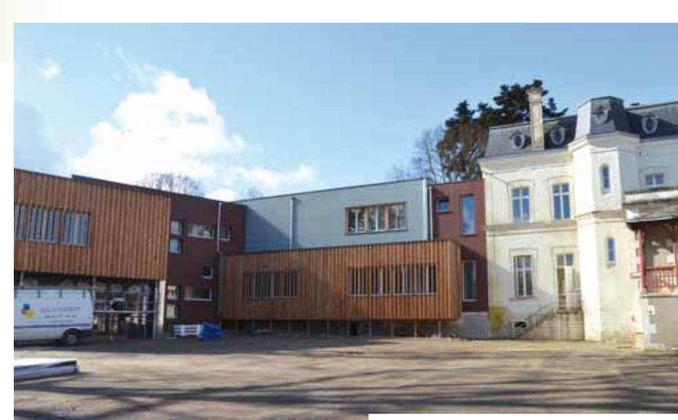
> Réouverture de l'école Richelieu : septembre 2014.

Aujourd'hui, les deux écoles Rabelais et Richelieu, rassemblées d'un point de vue administratif, sont géographiquement réparties sur deux sites distants d'environ 1 km, ce qui entraîne des difficultés pour les parents d'élèves et les instituteurs. Par ailleurs, l'école Rabelais est très énergivore. Les travaux d'agrandissement de l'école Richelieu visant à rassembler les deux écoles sur un seul et même site ont débuté en janvier 2013 et sont en phase de finition.