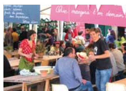
> Agri-cultures en fête en 2013 au village du Louroux.

Dimanche 8 juin, de 11h à 21h à la Closerie de Chanteloup, venez profiter d'une journée champêtre ! Repas paysan, marché bio, concerts, jeux, animations enfants et tout au long de la journée, des temps d'échanges et mini-conférences sur l'installation de nouveaux agriculteurs autour d'Amboise. « Habitants du coin, agriculteurs et associations, nous voulons que cette journée soit l'occasion de fêter notre citoyenneté et notre lien à l'agriculture.