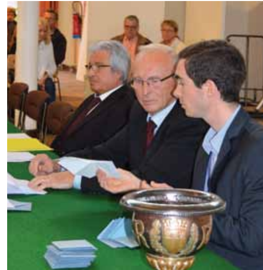
> Élection du Maire à bulletin secret.

Le Maire s'est ensuite adressé à toute son équipe et aux Amboisiens présents : « Pendant ces 6 prochaines années il s'agira de continuer à construire la ville de demain tout en faisant vivre la ville d'aujourd'hui. Nous serons assistés dans ce travail par les personnels municipaux dont je salue la compétence, la loyauté et l'excellence de l'action produite depuis 13 ans au quotidien. Les électeurs nous ont une fois encore, une troisième fois, clairement légitimés. Ils nous ont dit leur satisfaction du travail accompli depuis 2001 et leur souhait que nous poursuivions dans ce sens, sur la base du projet précis, concret, détaillé et chiffré soumis à leurs suffrages. Nous mettrons en œuvre, un par un, chacun des 140 engagements de notre projet pour Amboise, sans qu'il soit besoin de nous les rappeler. Nous prendrons aussi toute notre place et toutes nos responsabilités dans la Communauté de communes du Val d'Amboise, nous qui avons tant œuvré pour que la fusion de nos deux ex-communautés se fasse.