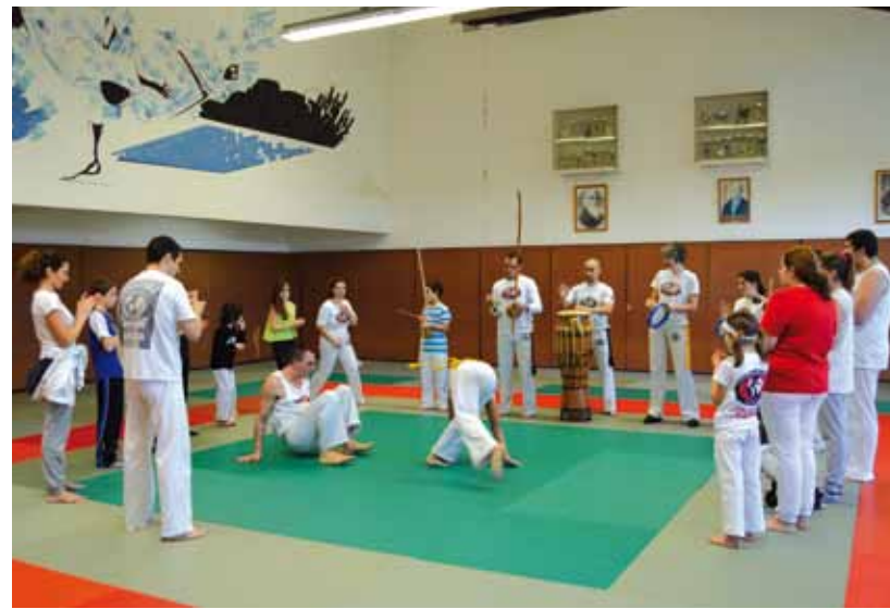
> Initiation à la capoeira avec On'sport dimanche au dojo du gymnase Ménard.

On'sport dimanche, c'est la possibilité de découvrir et de s'initier en famille à des pratiques sportives un dimanche par mois (de 10h à 12h30) avec une participation financière de 1 € pour les Amboisiens et 2 € pour les non Amboisiens. Retour sur les initiations des mois de février et mars.