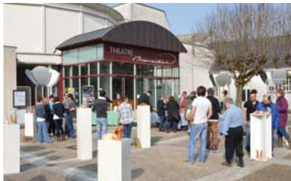
> Des patients ont exposé leurs œuvres.

À l'occasion de la Semaine d'Information sur la Santé Mentale, le Centre Communal d'Action Sociale d'Amboise et le docteur Préal, psychiatre ont programmé plusieurs rencontres, conférences et débats à la médiathèque Aimé Césaire.