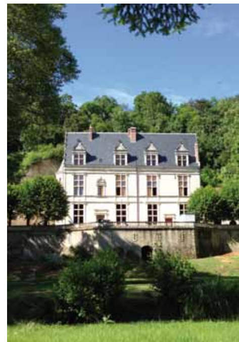
> Le château Gaillard, en cours de rénovation, a appartenu à Charles VIII et Louis XII.