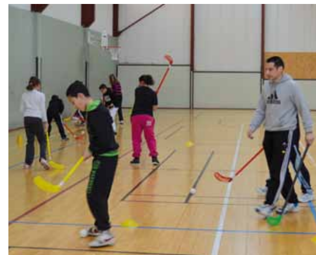
> Initiation au unihockey : deux équipes essaient de mettre une balle dans le but adverse à l'aide d'une crosse.

Encadrés par l'éducateur sportif de la Ville d'Amboise, ce sont près de 20 participants pour chaque tranche d'âge qui ont bénéficié d'initiations sportives axées sur la découverte de nouvelles activités et parfois déclinées sous forme de tournois. Les plus jeunes se sont essayés au unihockey, handball, tennis et jeux traditionnels, tandis que les plus de 12 ans se sont affrontés au basket, tchoukball, badminton et futsal. Ces animations ont connu un véritable succès puisque plusieurs créneaux horaires étaient complets.