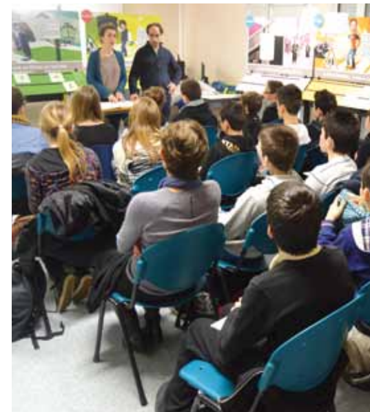
> Présentation du système judiciaire aux élèves des collèges Choiseul et Malraux.

Du 17 au 21 février, toutes les classes de 4 ème des collèges Choiseul et Malraux ont bénéficié d'une présentation, sous la forme d'une exposition interactive, de la loi et du système judiciaire. Que sont les devoirs, les droits, les infractions ? Autant de questions autour de la citoyenneté auxquelles les deux intervenants se sont attachés à répondre de manière simple et claire.