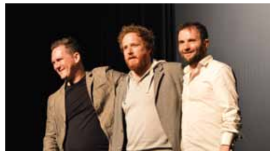
> Trois hommes au récit touchant et drôle.