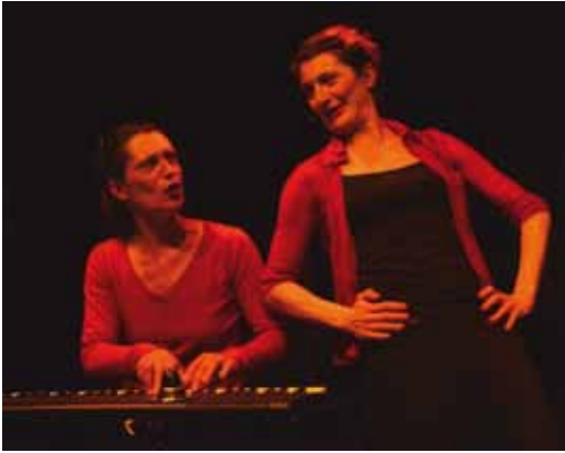
> Il était une... un spectacle plein de tendresse.

Concert, danse, récit, spectacle jeune public... Humour, poésie, tendresse... Le début de l'année 2014 aura été riche en rendez-vous !