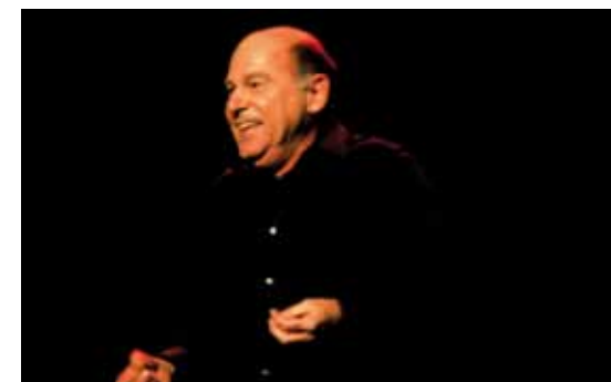
> De l'humour et du sarcasme avec Didier Bénureau.

Tel un clown, Didier Bénureau est monté sur scène en dansant sur un rythme effréné et a offert au public une compilation de ses meilleurs sketches. Du "beauf" qui va le samedi au supermarché, en passant par le chanteur lyrique de Fukushima (qui affirme avoir une plus grande tessiture depuis l'accident nucléaire), sans oublier la chanson du soldat Moralès, Didier Bénureau aborde des sujets tabous, sans retenue. À la fin du spectacle, sous un tonnerre d'applaudissement, il a déclaré « Ce vendredi 4 avril est la première date de ma tournée. Si tous les publics sont comme vous, ce sera vraiment génial ! ».