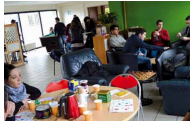
> Inauguration de la Quinzaine de la Parentalité à l'ASHAJ.

Les jeux vidéo sont très réalistes aujourd'hui : la qualité des images et des animations peuvent nous faire confondre la réalité et la fiction. Ces prouesses technologiques offrent aux amateurs de jeux un plaisir décuplé, ouvrant un imaginaire sans limite. Mais cette perfection peut également provoquer des addictions, chez les jeunes notamment. En s'enfermant dans un monde virtuel, en devenant le personnage de ses rêves, en se coupant de sa famille, de ses amis, de l'école, le jeune peut facilement se déconnecter du monde réel. Le jeu vidéo est également l'occasion de braver les interdits. Mais le jeu ne doit pas être considéré uniquement comme mauvais,