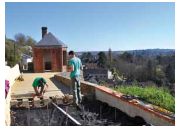
> Pose de la terrasse en bois par la société Amboise Paysage.

geant une terrasse en bois. Au préalable, une étude de stabilité du site (qui est en tête de coteau) avait été réalisée par un bureau d'études géotechniques sur recommandation du syndicat intercommunal Cavités 37. L'entreprise Kanopé, spécialisée dans le confortement et les travaux acrobatiques, avait alors entrepris de renforcer le coteau. Le coût des travaux s'élève à 80 000 € dont une partie est subventionnée par la fondation du patrimoine pour la maçonnerie effectuée par l'entreprise d'insertion. Ce point de vue s'inscrit dans une démarche globale de mise en valeur du plateau des Châteliers et de