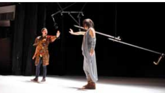
> De la danse et du chant lyrique avec Yeeeppee !!!

Il était une... petite Josette ! Mercredi 13 mars, la médiathèque Aimé Césaire mettait à l'honneur des textes d'Anne Sylvestre, sobrement mis en scène par deux comédiennes. Devant un très jeune public, la comédienne et la musicienne de la compagnie Les Elements Disponibles ont chanté, raconté, échangé... sur les aventures quotidiennes de la petite Josette. Le spectacle débute avec l'arrivée inopinée d'une des protagonistes. Heureuse de trouver un piano, elle commence à jouer un très bel air classique... À peine sa comparse entre sur scène qu'elle s'arrête de pianoter et que... la musique continue ! Et puis l'histoire commence, l'histoire d'une petite Josette qui va à l'école avec ses moustaches de chocolat