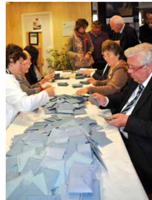
> Comptabilisation des enveloppes avant de procéder au dépouillement.