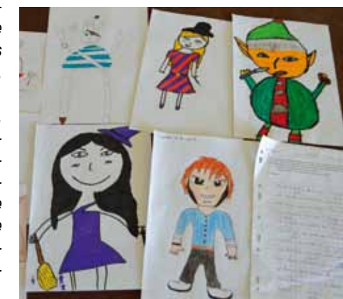
> Les enfants ont écrit des histoires et réalisés des dessins pour un livre qui paraîtra fin mai.

Les CP et CE1 ont quant à eux créé sept histoires alors que chacun des élèves de CE2, CM1 et CM2 a réalisé son histoire accompagnée du dessin de son héros. Début avril, tous les travaux des enfants ont été remis au graphiste pour la mise en page avant l'envoi chez l'imprimeur. Le livre paraîtra fin mai et chaque enfant recevra son exemplaire. Les livres seront en vente à prix coûtant... en série limitée !