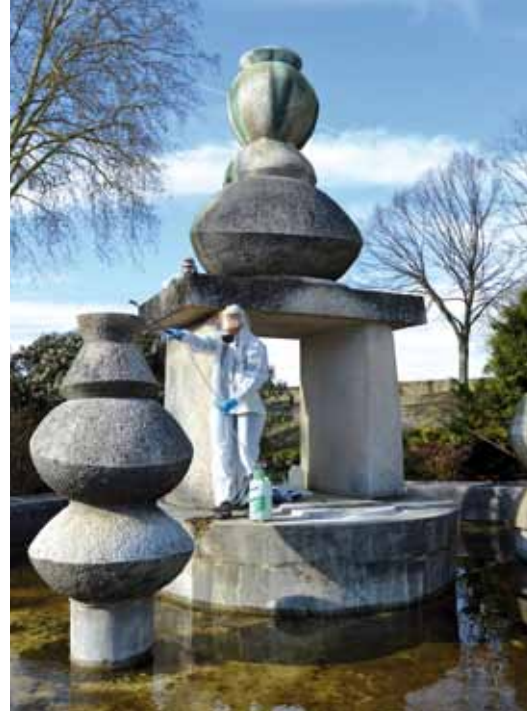
> Élimination des mousses.

Depuis début mars, les travaux de restauration de la fontaine de Max Ernst ont pris un nouveau tournant avec les premières réunions de chantier en présence de l'architecte des Bâtiments de France, l'architecte des Monuments Historiques, les représentants du CNAP (Centre National des Arts Plastiques - propriétaire de l'œuvre), les services de la Ville d'Amboise et les artisans qui participent à la restauration de l'œuvre. Ces réunions permettent à chacun de suivre l'avancement du chantier et de finaliser les choix paysagers : essences des arbres, mobilier urbain (lampadaires, bancs...).