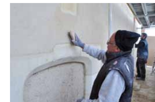
> Les maçons réalisent l'enduit de la façade nord.

la rue Léonard Perrault. La Ville a déjà entrepris plusieurs actions dans ce quartier dont l'achat puis la rénovation des façades de plusieurs caves. La fin des travaux est prévue fin avril.