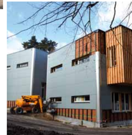
> Finitions des travaux extérieurs.

Le bureau d'études thermiques G. Callu a réalisé des investigations qui ont permis de faire une simulation thermodynamique mettant en avant un calcul théorique d'économie d'énergie d'environ 94 % par rapport aux dépenses faites auparavant à l'école Rabelais. La nouvelle chaufferie de l'école Richelieu alimentera également une sous-station de l'école maternelle Anne de Bretagne.