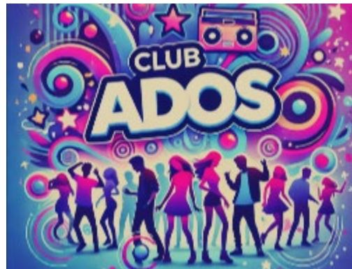
Un logo pour le Club Ados

Le Pep'it Lab et le Club Ados de la CCVA s'associent pour un atelier collaboratif unique : concevoir ensemble le futur logo du Club Ados qui sera bientôt fièrement affiché sur la borne d'arcade récemment acquise par le club. L'occasion pour les jeunes de laisser parler leur créativité tout en découvrant le processus de la création graphique