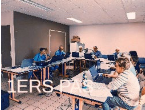
Cours 1ers pas

Chaque semaine, participez à notre atelier convivial pour découvrir les bases du numérique et vous exercer en toute simplicité. Envoyer un mail avec une pièce jointe, créer un mot de passe sécurisé, naviguer en toute sécurité ou apprivoiser les outils bureautiques, un accompagnement pour progresser à votre rythme.