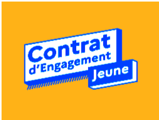
Mission locale (CEJ)

Les bénéficiaires du Contrat d'Engagement Jeune de la Mission Locale sont invités à explorer le Pep'it Lab : un espace dédié à l'innovation et au numérique. Au programme, découverte du lieu et des machines à commandes numériques, avec des démonstrations pratiques pour éveiller la curiosité.