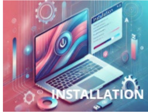
Installer un système

Apprenez à installer ou réinstaller un système d'exploitation sur votre ordinateur (Windows, Linux...) pour lui donner une seconde vie. Que ce soit pour résoudre des problèmes de lenteur, éliminer un virus ou simplement repartir sur une base saine, nous verrons quelles sont les étapes pas à pas en le réalisant en direct.