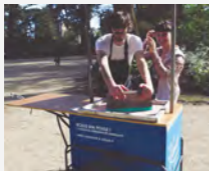
Stand présent sur le marché ligérien