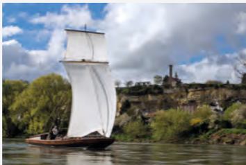
La flotte passe le pont. Remontée des mariniers