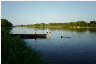
Nage en eaux vives