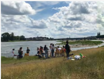
Parle Loire