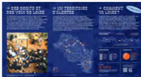
Exposition collective "Vers un Parlement de Loire"

Conçue et produite par le POLAU-pôle arts et urbanisme avec les contributions des membres du collectif l'exposition « Vers un parlement de Loire » met en récit la démarche. Elle est un support de médiation qui retrace la genèse du parlement de Loire pour faciliter la compréhension globale d'une démarche qui évolue au fil de l'eau avec des images, des textes et des renvois vers des œuvres sonores. Ses huit tables présentent les intentions, les inspirations (les luttes, droit de la nature...), les diverses actions qui se sont déroulées depuis 2019, les axes de poursuite et le Manifeste de Loire.