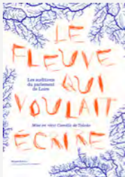
Le fleuve qui voulait écrire

La démarche du parlement de Loire est une fiction, une institution potentielle qui invite à se mettre à l'écoute de l'écosystème Loire et de ses alertes. A l'initiative en 2019 du POLAU - Pôle arts et urbanisme avec l'écrivain Camille de Toledo comme auteur associé, cette démarche culturelle de territoire rassemble depuis de nombreux partenaires ligériens. Elle participe à renouveler la façon d'aborder les contextes critiques, à partir du droit, des arts, de l'écologie, de l'anthropologie.