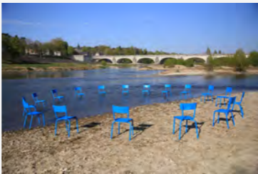
Les chaises bleues L'Assemblée immatérielle Zazu, 2021 © Francis Vautier

C'est dans la continuité de cet effet de présence que Zazû a travaillé au programme de la Grande Remontée de Loire pour septembre 2023 sur les sites du Thourell, Montsoreau, Bréhémont, Amboise, Chaumont, et Blois. Au fur et à mesure des escales, l'installation de l'assemblée immatérielle se verra augmentée d'une cabane flottante, de temps chorégraphiques, d'ateliers d'écoute de la Loire, de créations participatives de land art, etc.