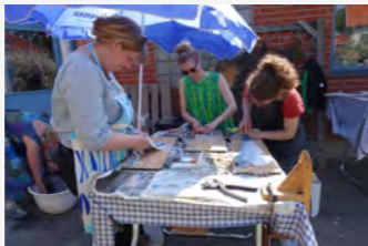
Tannerie peau de silure