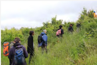
Balade et écriture sensible Marche Bedoire 26052021