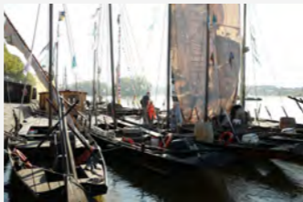
Bateaux Festival de Loire