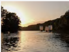
La Rabouilleuse École de Loire

À chaque escale, ils invitent le jeune et grand public à :